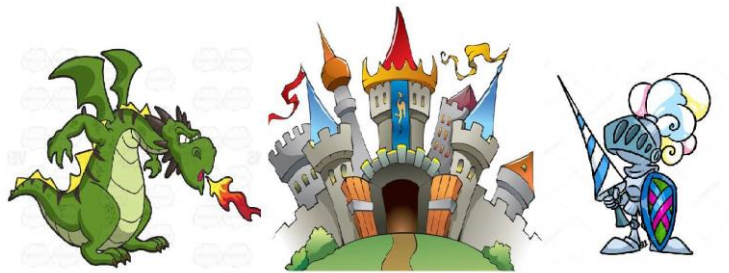
Taller Infantil. "Castillos, caballeros, dragones..."

¿Se puede conquistar un castillo bien defendi-do? ¿Cómo es esa defensa? ¿Quién vivía en estas grandes fortificaciones? ¿Son iguales todos los castillos? Las respuestas a estas cuestiones y otras muchas se encuentran en esta actividad.